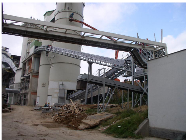
ocelová konstrukce dopravníků „HD“ a „KDH“

Byly provedeny prostorové výpočtové modely dopravníků včetně podpor a návazností na okolní stávající objekty. Dopravník „U“ má délku 150 m. Byl rozdělen a počítán na montážní kusy 25-50 m dlouhé. Dopravníky „KDH“ a „HD“ mají délky 35 a 54 m.