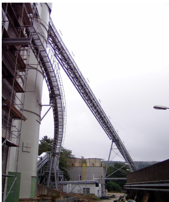
ocelová konstrukce dopravníku „U“