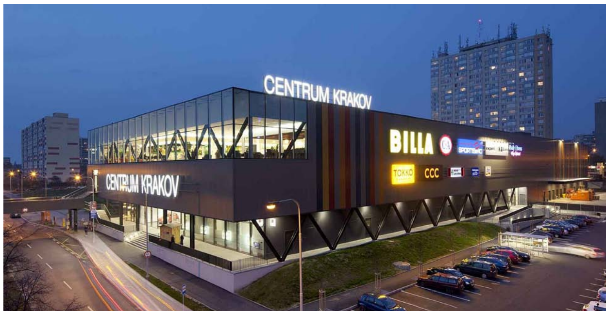
celkový pohled na rekonstrukci a dostavbu nákupního centra

Na projektu rekonstrukce nákupního centra se naše kancelář podílela návrhem ocelových nosných konstrukcí. Ocelové konstrukce fasád jsou navrženy z profilu HEB300 architektonicky navrženými do tvaru "V". Ocelové konstrukce slouží pro uložení krajních polí stropních desek a kazetového fasádního pláště. Půdorysné rozměry objektu jsou cca 50 x 150 m.